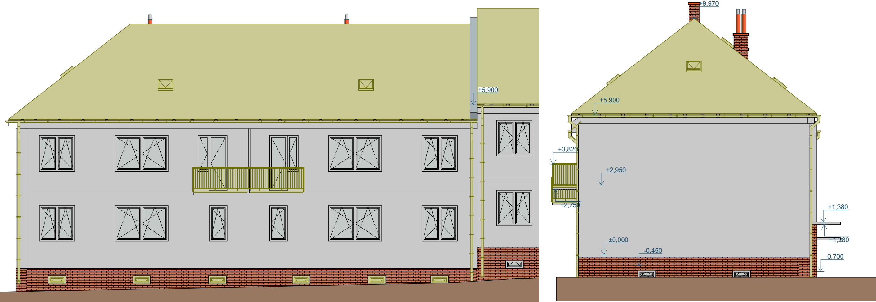
Pohled severní Bourací práce 1:100 Pohled západní Bourací práce 1:100